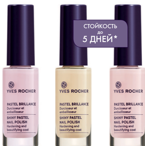
Флакон 5,5 мл - 79 грн.