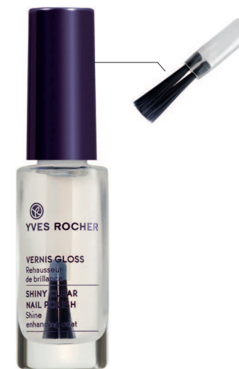
Флакон 5,5 мл - 79 грн.

Ego + : Двойная широкая кисточка позволяет наносить лак быстро, одним движением.