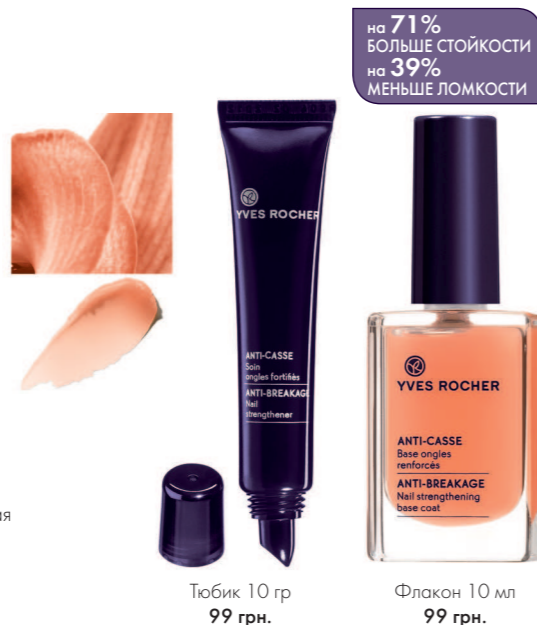
Тубик 10 гр - 99 грн.

Насыщенный тающий бальзам для укрепления ногтей. Благодаря своей формуле на основе масла какао, это укрепляющее средство с тающей текстурой интенсивно питает ногти и прилегающую кожу. Регулярное нанесение этого лечебного бальзама возвращает сухим, хрупким и ломким ногтям их гибкость и эластичность. Такое питание укрепляет, регенерирует ногтевую пластину, делаете более резистентной. Руки становятся красивыми и заметно ухоженнее.