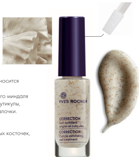
Флакон 5,5 мл - 99 грн.

Ego + : с помощью специального шпателя Вы сможете нанести необходимое количество средства. Растительные компоненты: молочко сладкого миндаля, абрикосовое масло, порошок абрикосовых косточек, экстракт бамбука, водный экстракт гаммamelиса Био.