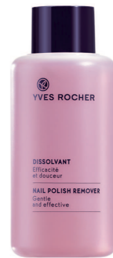
Флакон 100 мл - 65 грн.