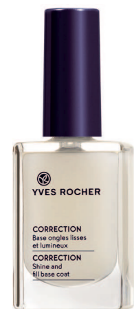
Флакон 10 мл - 99 грн.