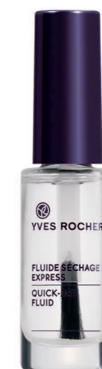
Флакон 5,5 мл - 79 грн.

Теперь в Вашей косметичке появилось средство для профессионалов! Вам уже не придется долго ждать после нанесения последнего слоя лака: всего одна капля Экспресс-сушки на каждый ноготок и лак моментально высыхает и приобретает стойкость. А ногти становятся еще более блестящими.