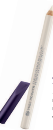
Карандаш 1,1 г - 59 грн.

Они так необходимы для безупречного французского маникюра! Самоклеющиеся полоски облегчают нанесение белого лака на нижний край ногтя.