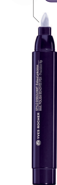
Стик 3 мл - 115 грн.

УДОБНЫЙ КОНЧИК идеален для быстрой и точной корректировки маникюра