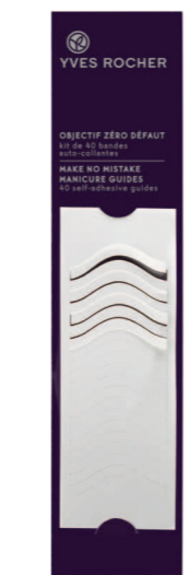
40 полосок - 45 грн.

Легкий в использовании, этот карандаш искусно очерчивает и отбеливает выступающую поверхность под ногтем, обеспечивая натуральный аккуратный и завершенный вид Вашему Французскому Маникюру. А специальная форма его колпачка позволит Вам с легкостью отодвигать кутикулы.