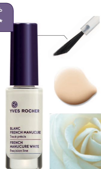
Флакон 5,5 мл - 79 грн.